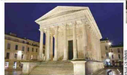
VILLE DE NÎMES

« patrons » de la cité. Leur mort prématurée (en 2 ap. J.-C. pour Lucius, à 18 ans, et en 4 ap. J.-C. pour Caius, à 23 ans) poussa les élites nîmoises à transformer leur premier projet de forum pour y élever, en signe de loyauté, un temple dynastique. Il reste à ce jour le temple le mieux conservé du monde romain. De plan rectangulaire (31 m x 15 m), sa dénomination de « carrée » tient au fait qu'à l'époque, la figure géométrique du rectangle n'existant pas, on parlait de carré long.