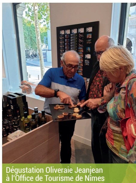
Dégustation Oliveraie Jeanjean à l'Office de Tourisme de Nîmes