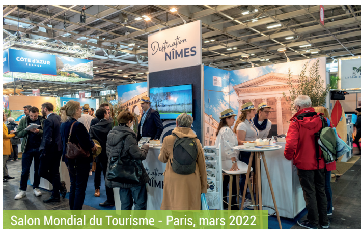
Salon Mondial du Tourisme - Paris, mars 2022