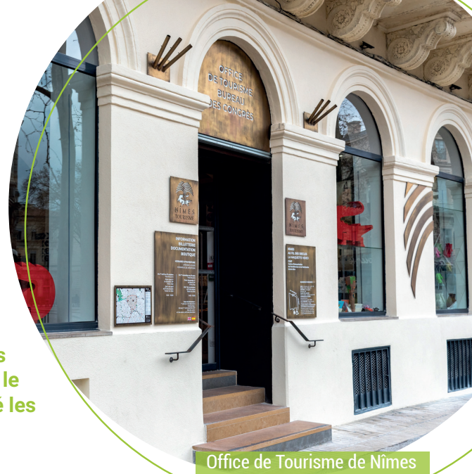
Office de Tourisme de Nîmes

Travailler au sein d'un établissement respectueux de l'environnement est une de nos priorités. Ainsi, nous avons réaménagé en 2019 notre bureau d'accueil principal, dans le respect des normes et réglementations en vigueur et privilégié les équipements favorisant les économies d'énergie.