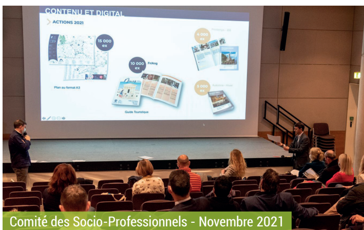
Comité des Socio-Professionnels - Novembre 2021