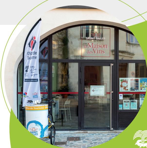
Bureau de Saint-Gilles